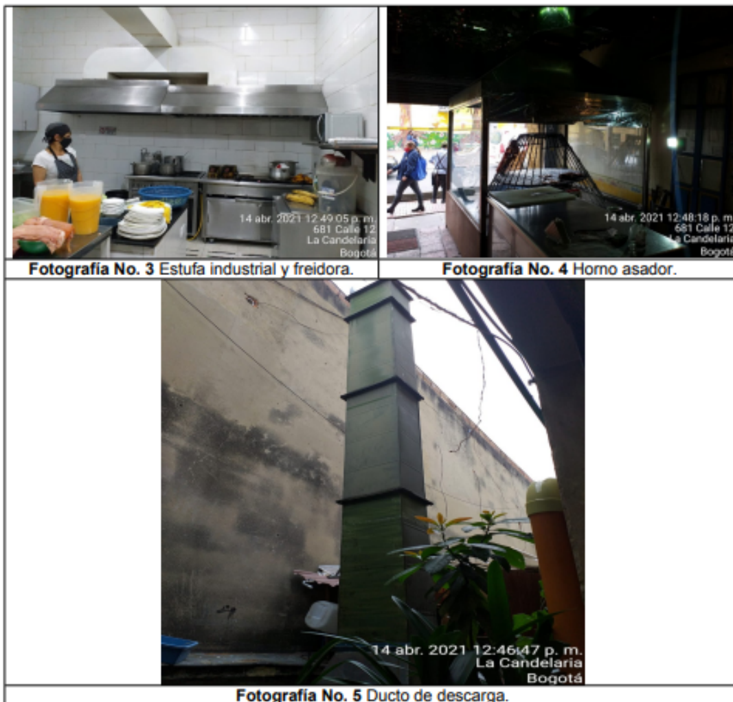
Fotografía No. 3 Estufa industrial y freidora.